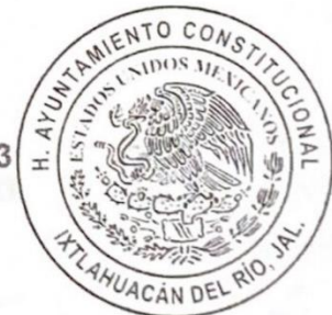
COMISIÓN MUNICIPAL DE REGULARIZACIÓN